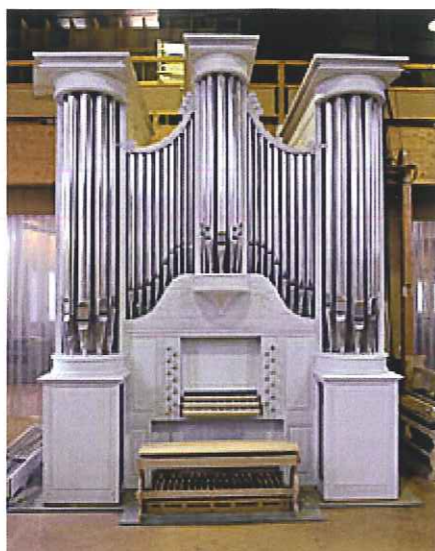
Orgue de Brunoy restaurée par Bertrand Cattiaux

définir sur quel marché nous souhaitions intervenir. Une première approche concernait les pays d'Amérique du Sud vers lesquels les facteurs français du XIX ème siècle ont beaucoup exporté. Mais, il s'agissait plus de marchés de restauration. Nous avons finalement opté pour une mission vers les Etats-Unis.